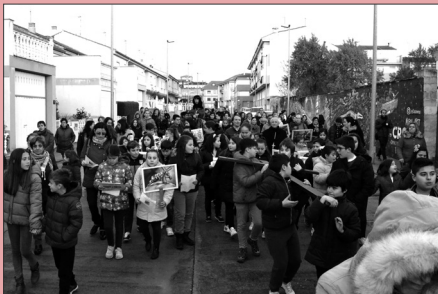
Via Crucis de los niños