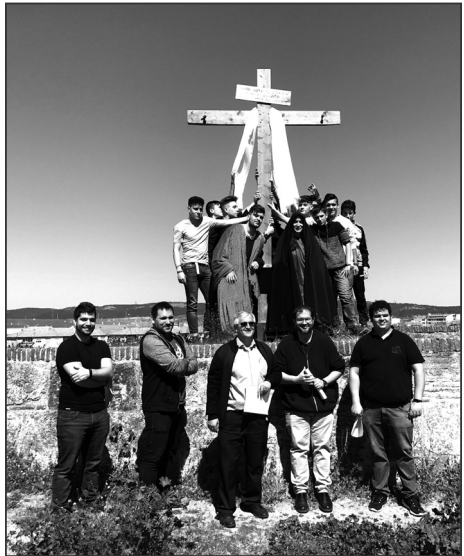
Presentación de La Pasión 2019 en la muralla

En la presentación de este calendario no dudaron en hincar la cruz en la muralla de Ciudad Rodrigo en la zona conocida como La Brecha e hicieron memoria de lo que supuso el pasado año su 25 aniversario recordando, por otra parte, que ninguna de las representaciones ha sido igual a pesar de lo dilatado de la trayectoria.