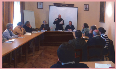
Encuentro del Arciprestazgo de Ciudad Rodrigo

El administrador apostólico de la diócesis, Mons. Jesús García Burillo, ha sido el encargado de presidir los encuentros arciprestales de mitad de curso que se han celebrado a lo largo de los últimos días. Estas reuniones se trasladaron a todos los arciprestazgos de la diócesis y siguen la misma estructura en cada una de las oportunidades. Así, se fija un tiempo para orar, meditar y para vivir más plenamente el tiempo de Cuaresma.