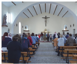
Celebración en Ciudad Rodrigo y en Fuentes de Oñoro