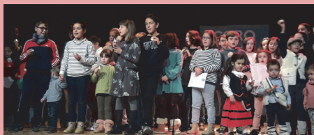
Los participantes disfrutaron en la cita.

Además de los grupos de niños, actuó el coro de la Pastoral Juvenil que interpretó varios villancicos. En el transcurso del festival se aprovechó para hacer entrega de los premios del I Concurso de Belenes organizado por la parroquia de Sancti Spíritus para fomentar esta tradición cristiana.