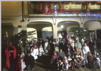
Foto de familia de los figurantes.

La parroquia de La Fuente de San Esteban en colaboración con el Ayuntamiento trasladó el sentido de la Navidad a las calles del pueblo organizando un Belén viviente. En total participaron 35 figurantes y fueron muchos los vecinos del pueblo que se acercaron a ver la escenificación.