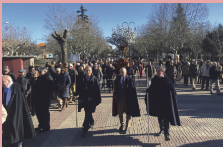
Los mayordomos encabezaron la procesión.