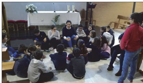
Un grupo de catequesis en la parroquia de El Salvador.