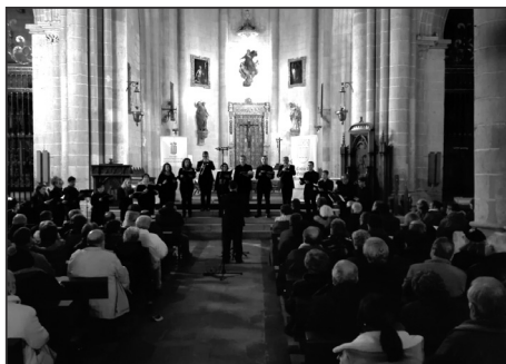
Reciente concierto con motivo del homenaje a Juan Esquivel

Hace tan solo unos días, precisamente, la Catedral de Santa María acogía un concierto y homenaje al que fuera maestro de capilla, Juan Esquivel de Barahona.