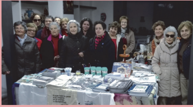
Voluntarias de la delegación en la inauguración del rastrillo