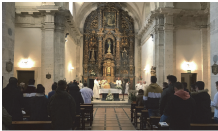
Celebración de la Eucaristía con motivo de la fiesta

El Seminario de Ciudad Rodrigo ha celebrado diversas actividades con motivo de la festividad de San Cayetano. En concreto, los alumnos, algunos formadores y familiares se trasladaron a Madrid para realizar un recorrido turístico en el que también disfrutaron del musical titulado '33'. Estos actos concluyeron con una Eucaristía en la capilla mayor del Seminario que fue concelebrada por varios sacerdotes y además, con la proyección en el cine de la última producción sobre el Papa Francisco. El Seminario San Cayetano celebrará en 2019 su 250 aniversario.