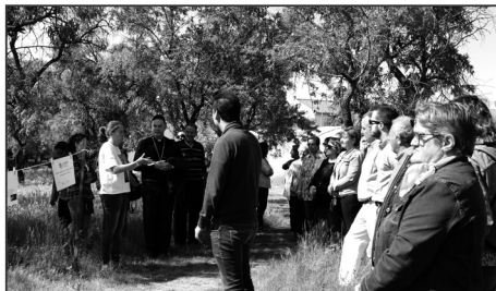
Huertos de Cáritas

Coincidiendo con este Día de Caridad, la delegación diocesana de Cáritas ha presentado su memoria que está plagada de números, pero sobre todo, tal y como recuerdan siempre desde la entidad, de rostros detrás de cada cifra.