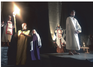
Una de las escenas de la Pasión

Sin duda, quedará para el recuerdo la escenificación de la Pasión llevada a cabo este año coincidiendo con el 25 aniversario de la primera representación. Debido a la climatología, los promotores se decantaron por llevar su trabajo a dos escenarios únicos: la Catedral y el Seminario, con momentos que no dejaron indiferentes a nadie.