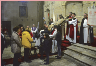
Los fieles, en un momento del Besapiés