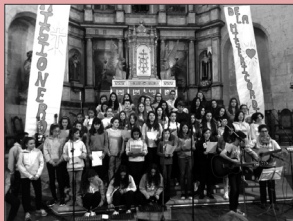
Festival Interdiocesano 2016

que desde las diversas diócesis españolas han salido para anunciar el Evangelio en las periferias de nuestro mundo. También cada uno de nosotros podemos y debemos salir de nuestra realidad concreta, "atrevernos a algo más" en la vida de fe, en la vida de compromiso eclesial y social. Los jóvenes y niños que nos visitarán estos días harán que esta llamada resuene en nosotros con sus canciones. No ignoremos esta llamada que el mismo Jesús nos hace, y unámonos a esta fiesta misionera con nuestra presencia, con nuestra alegría y oración.