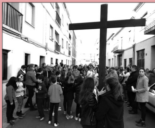
El obispo en un acto junto a niños

Saldremos a las 17,30 h. desde el patio de las Misioneras de la Providencia y recorreremos las calles acompañando la Cruz y la imagen de la Virgen María hasta la parroquia de El Salvador. Estamos todos invitados. Arropemos a nuestros niños y ayudémosles a entrar con fe en la vivencia de los misterios de nuestra Salvación.