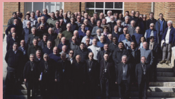
Participantes en el encuentro de Villagarcía

El impulso de los dos Sínodos sobre la familia y la Exhortación apostólica postsinodal Amoris laetitia sigue vivo en la acción pastoral de la Iglesia, por eso,