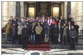
Participantes en el Encuentro de Seminaristas Mayores

Bajo el lema ‘Apóstoles para los jóvenes’ se celebra este año el Día del Seminario. Esta jornada tiene lugar cada 19 de marzo, solemnidad de San José, pero en aquellas comunidades autónomas en las que no es festivo, el domingo más cercano, en este caso, el 18 de marzo.