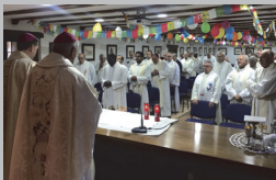
Eucaristía durante la convivencia