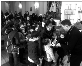
El obispo en un acto junto a niños

Lo Primero, acoger en la línea de lo que nos dice la Biblia: "No olvidéis la hospitalidad; por ella, algunos, sin saberlo hospedaron ángeles" (Hb 13,2).