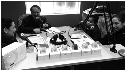
Miembros de la delegación de misiones