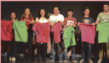
Un momento del musical

La diócesis de Ciudad Rodrigo, a través del Departamento de Evangelización y Nuevas Tecnologías, organizó esta gala benéfica que salió adelante gracias al patrocinio de 30 particulares, parroquias y casas religiosas y todo lo recaudado con la entrada irá a parar a manos de Cáritas, Manos Unidas, Conferencias de San Vicente de Paúl, Hijos del Maíz e Infancia Misionera.