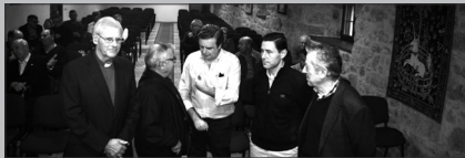
Responsables de las obras y del Cabildo

En primer lugar aclararon que esta obra había afectado al claustro de la catedral y a sus cubiertas y que, sin duda alguna, las humedades eran uno de los mayores problemas que presentaba esa zona.