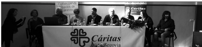
Representantes de Ciudad Rodrigo en las Jornadas