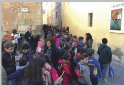
Escolares a la entrada del cine

Este festival, organizado por la asociación Kinema 7, está apoyado por la Diócesis de Ciudad Rodrigo y el Ayuntamiento.