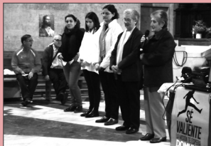
Celebración en El Sagrario

evangelizadoras y de su profundo testimonio de fe. Además hemos celebrado la Vigilia de la Luz como preparación inmediata a la Jornada del DOMUND, con varios testimonios misioneros; y también salimos con las huchas por nuestras calles. Y qué mejor forma de acabar el mes que con "Holywins", mirando a los santos como grandes superhéroes y presentando a su lado la figura de otros superhéroes que viven entre nosotros: los misioneros. Todo nos invita a "ser valientes" y descubrir que "la Misión nos espera": ¿dónde? ¿cuándo? ¿cómo? ¡Abramos bien los ojos y corazón!