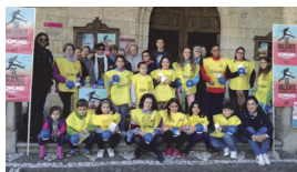
Participantes en la actividad

La delegación de Misiones de la diócesis de Ciudad Rodrigo ha celebrado a lo largo del mes de octubre diversas actividades con motivo del Domund. Además de contar con la presencia de diversos misioneros, también los niños tomaron protagonismo y salieron a las calles con las huchas del Domund como gesto y en señal de recuerdo de todos los misioneros de la diócesis.