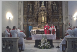
El cardenal presidiendo la Eucaristía en la capilla del Seminario.