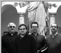
Los seminaristas mayores con el Rector y el párroco de San Cristóbal

se a disposición de la Iglesia haciendo: "Aquí estoy Señor para hacer tu voluntad, envíame". El siguiente paso será ya la ordenación de diácono. Damos gracias a Dios por su vocación, a las parroquias de Castillejo de Martín Viejo y de san Cristóbal donde han crecido en la fe; a nuestro Seminario Menor donde ha germinado su vocación sacerdotal y al Teologado de Ávila y la Universidad Pontificia de Salamanca. Toda la comunidad cristiana de nuestra diócesis se alegra por es-