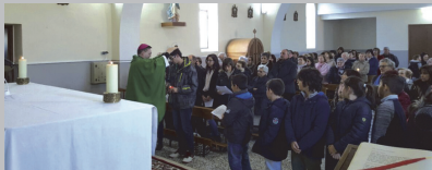
Uno de los retiros arciprestales celebrados

El obispo, Mons. Raúl Berzosa, y el vicario de Pastoral, José Manuel Vidriales, están acudiendo a cada uno de esos arciprestazgos y entre las acciones se incluye una Eucaristía en la que en algunos casos, los jóvenes han recordado la confirmación; los matrimonios han renovado las promesas matrimoniales; los sacerdotes y religiosos sus votos y todos juntos renuevan las promesas bautismales.