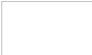
Participantes en el encuentro

Por parte de la diócesis civitatense acudieron el obispo, los dos vicarios, seis arciprestes, el matrimonio delegado de Familia y el consiliario de esa delegación.