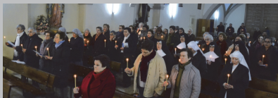
Participantes en la eucaristía

Berzosa manifestó que "además de la esperanza, donde hay consagrados, se palpa la alegría" y recordó que es el propio Papa Francisco el que nos habla constantemente de esas dos cuestiones y "anima a los consagrados a abrazar el futuro con esperanza. Sin ocultar las muchas dificultades, como son: disminución de vocaciones, el envejecimiento, la cultura adversa a los compromisos duraderos o la incompreensión".