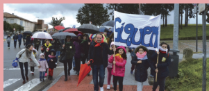
El lema 'Sigueme' abrió la marcha

Todos los encuentros darán comienzo a las 11 h. y estarán presididos por el obispo y el Vicario de Pastoral.