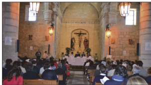
Como en la Asamblea Diocesana (en la imagen) de nuevo los laicos tomarán la palabra

víspera de Pentecostés, a partir de las 17,00 horas en el Salón Obispo Mazarrasa del Obispa-do. Los Delegados de Catequesis y Evangelización, a la luz de la Exhortación Evangelii Gaudium y de las Propuestas de la Asamblea Diocesana ayudarán a discernir el momento presente. Habrá también un trabajo-reflexión por arciprestazgos y puesta en común. Se concluirá con la Eucaristía en la Catedral a las 19,30 horas y posterior convite en el Seminario. Por expreso deseo del Sr. Obispo, secundando la iniciativa de la Conferencia Episcopal Española aprobada en su última Asamblea Plenaria, en la Misa de Vigilia de Pentecostés se tendrán muy presentes a los cristianos perseguidos en el mundo.