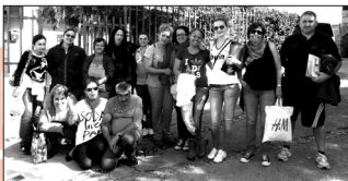
Grupo Acción Formativa

La Red de Apoyo Mútuo de Cáritas Diocesana de la Raya, a la que pertenece Cáritas Ciudad Rodrigo, acaba de publicar un