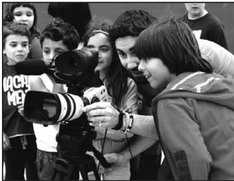
Los pequeños de Agallas disfrutaron en el Taller de Cine

El pasado día 9 de junio en Agallas se terminó el periplo por ocho municipios de la comarca de Ciudad Rodrigo del proyecto "Una Tierra de cine". Este proyecto comenzó el pasado 18 de mayo en la Fuente de San Esteban, donde tanto niños como mayores, han asistido a los talleres cinematográficos y a las proyecciones al aire libre, siempre que la meteorología lo ha permitido.