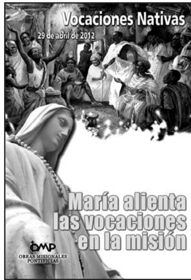
Cartel de la Jornada de las Vocaciones Nativas

Siendo una actividad evangelizadora, no se conceden premios en metálico. Se hará una valoración positiva de cada uno de los grupos y se entregará un recuerdo a cada grupo participante.