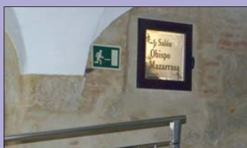
Vestíbulo del nuevo Salón de actos

La Diócesis de Ciudad Rodrigo cuenta, desde el Martes Santo, 3 de abril, en el que se procedió a su bendición, con un nuevo Salón de actos que dará servicio a toda la