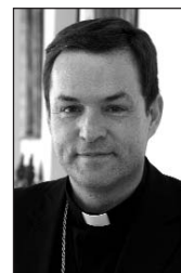
RAÚL BERZOSA MARTÍNEZ OBISPO DE LA DIÓCESIS DE CIUDAD RODRIGO

La segunda petición es complementaria de la primera: nuestras comunidades, ¿serán capaces de mostrar esperanza y de ofrecer alternativas de formas de vida? Y no sólo en lo económico. En este sentido, damos razón a Cáritas: "no seamos esclavos de falsas necesidades" . Una vez más, tenemos que hacer posible que todos en la Iglesia, especialmente los más necesitados, se sientan en ella como en su hogar, crezcan como en un taller de desarrollo integral y aprendamos unos de otros como si se tratara de una escuela. Y, sobre todo, aprendamos lo que nada ni nadie más puede aportarnos: a desentrañar y vivir el misterio total de Dios. Y, desde Dios, el misterio del ser humano. El redescubrimiento de estas dos realidades -Jesucristo y su Iglesia- harán posible que el año que comienza sea verdaderamente "nuevo" y que las bases de las llamadas unidades parroquiales sean más sólidas y realistas. ¡Feliz y fecundo año 2012!