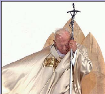
Juan Pablo II será beatificado el 1 de mayo en Roma

Información e inscripciones: 923 482 020 y 687 517 128.