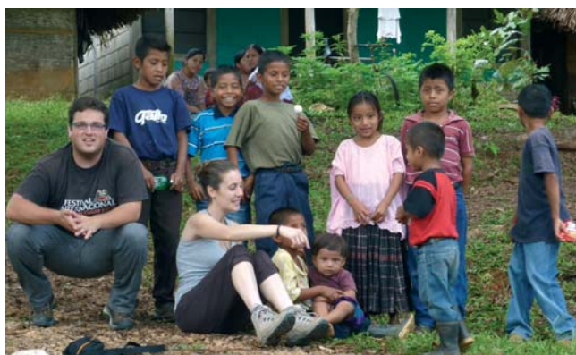
Dos de los jóvenes que vivieron una experiencia de cooperación en Guatemala, con niños q'ueqchies.