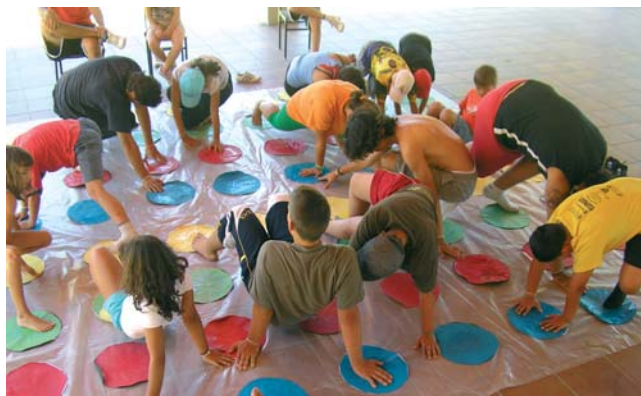
Talleres en el Campamento de la Parroquia de S. Cristóbal.