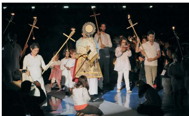
Peregrinación Europea de Jóvenes. 1 al 8 de agosto. Momento de la Vigilia de Oración