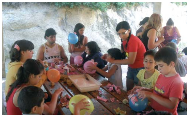
Una de las actividades del Campamento Diocesano.