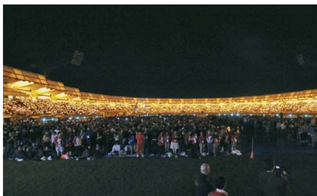
Estadio de San Lázaro en Santiago repleto de jóvenes. Antecala de la JMJ Madrid 2011.