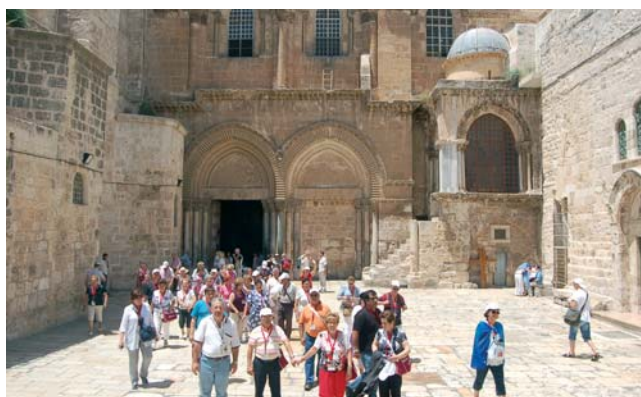
Los peregrinos civitatenses a la salida de la Basílica del Santo Sepulcro.