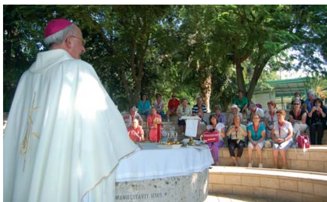
Una de las Eucaristías celebrada por los peregrinos diocesanos en Tierra Santa.