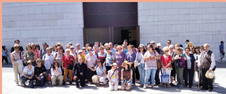
Grupo de San Andrés

Las parroquias de Castillejo de Dos Casas, Villar de Argañán, Alameda de Gardón, Gallegos de Argañán, Espeja y Fuentes de Ojoro han peregrinado durante el mes de junio al Santuario de Nuestra Señora la Virgen de Fátima. También lo hicieron posteriormente San Andrés y Alamedilla, Alberguería de Argañán y Puebla de Azaba.