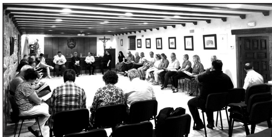
Consejo Pastoral Diocesano

Todo esto no se queda sólo en la revisión del camino hecho, sino que nos lanza hacia el futuro en un camino realmente abierto.