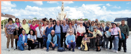
Uno de los grupos de Argañán