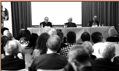
Ponentes participantes en las Jornadas

Bajo el lema “OMP: parte de la historia”, se han desarrollado en el Real Centro Universitario María Cristina de San Lorenzo de El Escorial, entre los días 22 y 24 de mayo, las Jornadas Nacionales de Delegados Diocesanos de Misiones y la Asam-