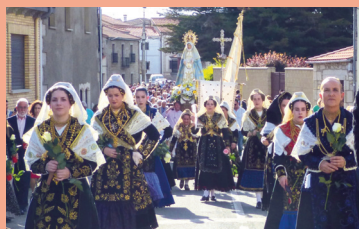
Procesi n por las calles de Villavieja