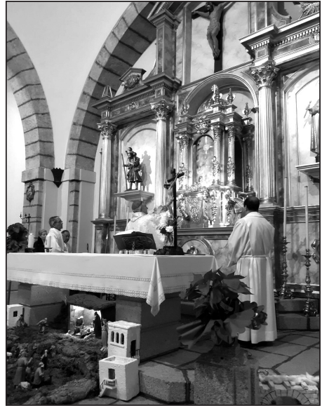
El Obispo bendice el nuevo altar

En el banco o parte baja del retablo se han colocado unos relieves a modo de tondos en los que se representan al pelicano dando de comer a sus crías en la calle central, el anagrama de la Virgen María bajo la imagen de la Virgen de los Remedios y el anagrama de la medalla de San Cristóbal. "SCPN" ("Sanctus Cristophorus protector noster" en latín, "San Cristóbal protector nuestro" en castellano) bajo la imagen del titular de la parroquia.