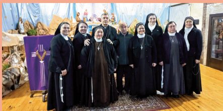
El Obispo junto a las Franciscanas del Zarzoso y en la residencia sacerdotal