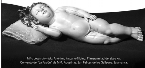
Niño Jesús dormido. Anónimo hispano-philipino, Primera mitad del siglo xvii. Convento de "La Pasión" de MM. Agustinas. San Felices de los Gallegos. Salamanca.