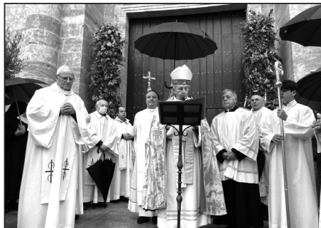
Un momento del acto de apertura

Don José Luis destacó muchos otros aspectos como que "es Él, el que sale a nuestro encuentro",