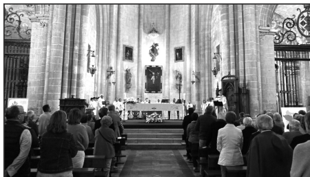
Celebración de la Eucaristía en la Catedral

Un Año Santo es una fiesta para la Iglesia católica, un momento de gracias y bendición, un tiempo para acercarse de mejor manera al Señor, y que tiene por objeto obtener la indulgencia plenaria. Según el catecismo, «la indulgencia es la remisión ante Dios de la pena temporal por los pecados, ya perdonados». Puede alcanzarse una vez al día y puede aplicarse por uno mismo o por los fieles difuntos. El Decreto de Penitenciaría Apostólica explica que únicamente los fieles “verdaderamente arrepentidos e impulsados por la caridad” podrán alcanzar la Indulgencia Plenaria, siempre y cuando atraviesen la Puerta Santa en alguno de los diez templos jubilaires teresianos, y participen en las condiciones acostumbradas: confesión sacramental, comunión eucarística y oración por las intenciones del papa Francisco. Unos gestos que se llevarán a cabo ante las reliquias de Santa Teresa o una imagen de la misma. Los ancianos, enfermos y