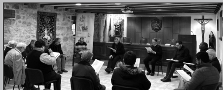
Miembros del Consejo Presbiteral