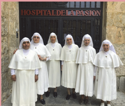
La comunidad de las Siervas de María