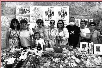
Miembros de la Delegación en el Martes Mayor

A lo vivido durante el mes de julio, añadimos la presencia en la calle con el puesto de la Delegación de Misiones en el Martes Mayor en pleno mes de agosto y las visitas de misioneros a los que hemos recibido a lo largo del verano. Así nos han visitado en estos meses los siguientes