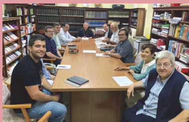
Claustro de profesores