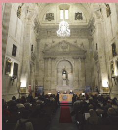
Presentación del encuentro