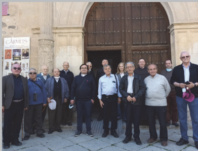
Los sacerdotes junto al Obispo