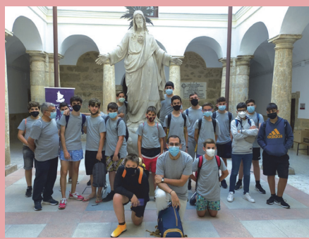
Los jóvenes antes de empear las actividades