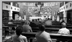
Residencia de San José