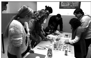
Taller de elaboración de galletas