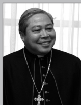
D. Bernardito Auza