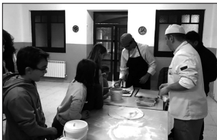
Taller de elaboración de pizzas

El punto de partida del evento fue la organización de lo que llamaron 'táper solidario', que consistía en que un grupo de empresas donaran una serie de comidas que los participantes se encargaron de comprar. En total se vendieron unos 300 ticket correspondientes a los menús elaborados por: Hotel Conde Rodrigo II-Restaurante la Muralla, Hotel Conde Rodrigo I- La Veinte, Parador, Restaurante La Bodega, Restaurante Florida, Restaurante la Artesa, Café D'Morán, Restaurante El Convento, Paellas Gigantes David, CocinArte Ciudad Rodrigo,