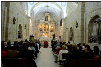
Celebración del tránsito de San Francisco en el Monasterio de las Claras en la noche del 3 de octubre