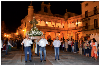
La procesión a su paso por la Plaza Mayor. Numerosos mirabrigenses participaron portando velas encendidas