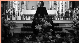
Celebración exequial del misionero Manuel García Viejo

Ante estos testimonios solo podemos dar gracias a Dios y pedir que sean semilla de cristianos. Frente a esta realidad, sobran los argumentos para exigir una colaboración, pero más que la aportación económica, que nunca agradeceremos lo suficiente, rogamos que por pequeña que sea, se realice desde el amor y la oración por aquellos para quienes el ébola no es más que un problema añadido, y por quienes hacen del ébola el mayor de sus problemas permaneciendo con los necesitados hasta la muerte.