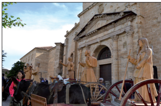
En la mañana del 4 de octubre se celebró un "Via Lucis"