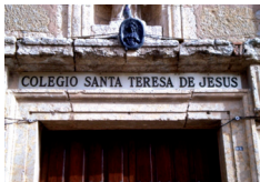
Las dos casas del carisma teresiano en nuestra ciudad: MM. Carmelitas y Compañía de Santa Teresa