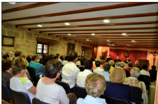
Ciclo de Conferencias del CTC: intervención del Cardenal Amigo el día 3 de octubre