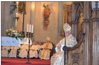
El Cardenal Carlos Amigo presidió una Vigilia por la paz en la que tuvieron protagonismo los jóvenes y el día 4, la Eucaristía en la Catedral