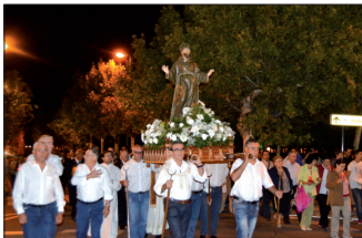
La imagen de San Francisco venerada en la Tercera Orden fue llevada en procesión hasta las S.I. Catedral en la noche del 3 de octubre