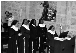
La comunidad de Clarisas está formada por seis religiosas

En el caso concreto de las Madres Clarisas, en estos momentos son seis las monjas que viven en el convento, tres de ellas son naturales de Ciudad Rodrigo y otras tantas de Kenia. Llama la atención la media de edad de las mismas, 36 años, las más baja de toda la federación de Santiago, a la que pertenecen, y que está compuesta por 37 conventos.