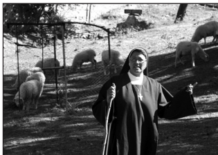
Una de las Franciscanas de El Zarzoso cuidando del rebaño

Viven el santo Evangelio en "obediencia, sin propio y castidad", y en su caso, habría que añadir un cuarto voto, la clausura